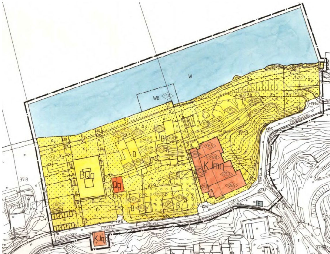
Figur 1. Plankarta DP 280