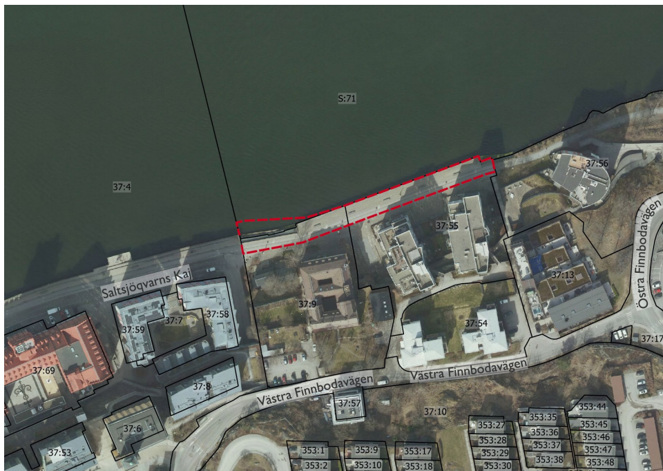
Figur 1. Kartan visar ett flygfoto över planområdet. Röd linje anger planområdets ungefärliga gräns.

Detaljplaneområdet är cirka 1650 kvadratmeter stort.