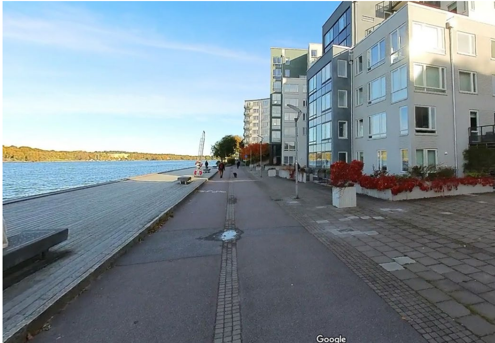
Figur 4. Gatubild på aktuella ytor.