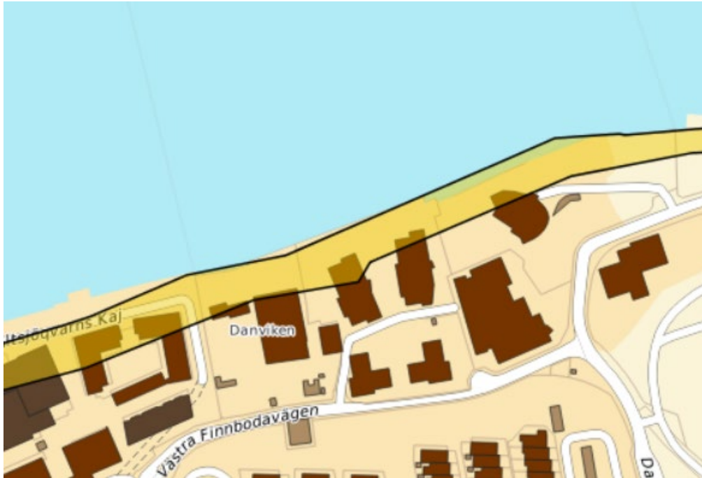
Figur 3. Generell skredrisk inom aktsamhetsområde. Underlag SGU:s skedriskarta.